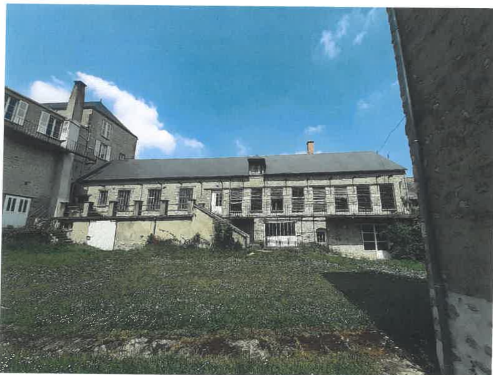
Vue sur le bâtiment de la tannerie n°2 (zone NJ) et du bâtiment de bureaux à gauche de la photographie (zone UA).