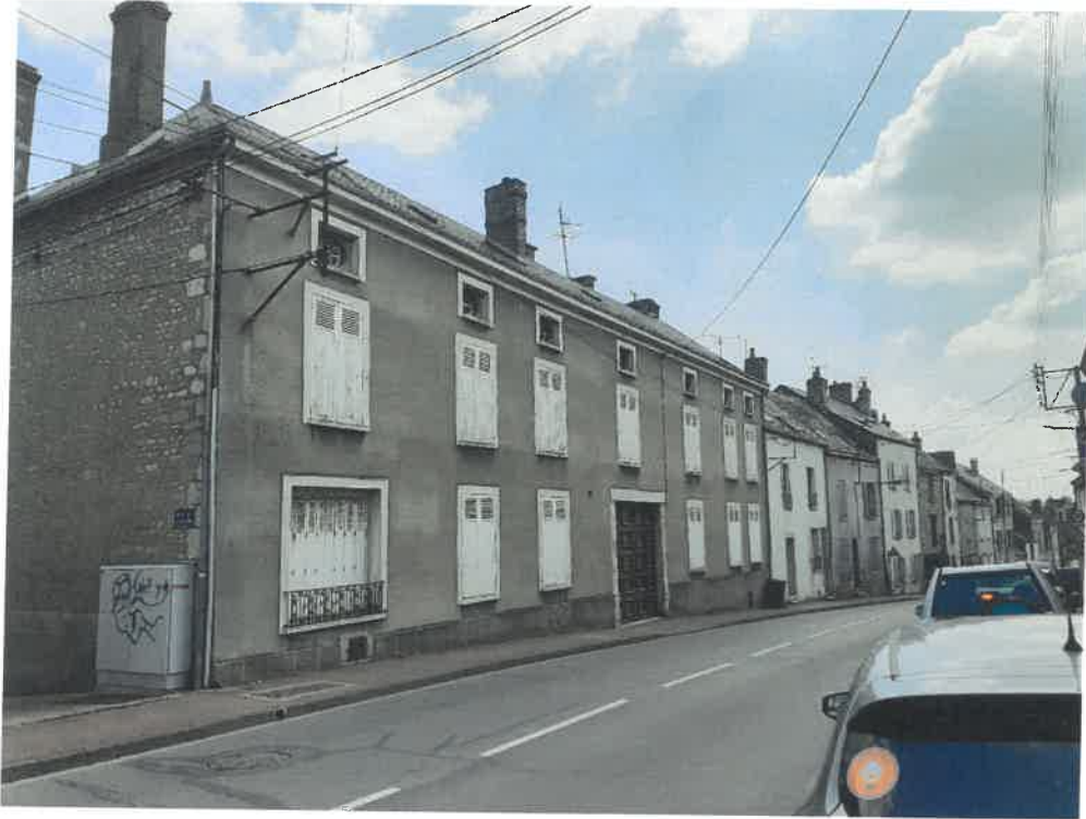
Façade habitation 39 faubourg du Gâtinais (zone UA)