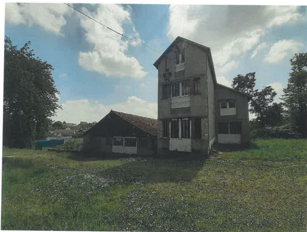
Vue sur le bâtiment de la tannerie n°1 et de la grange (zone NJ).