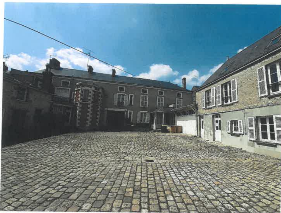
Vue sur la cour intérieure de la façade d'habitation du 39 faubourg du Gâtinais et des bureaux (zone UA)