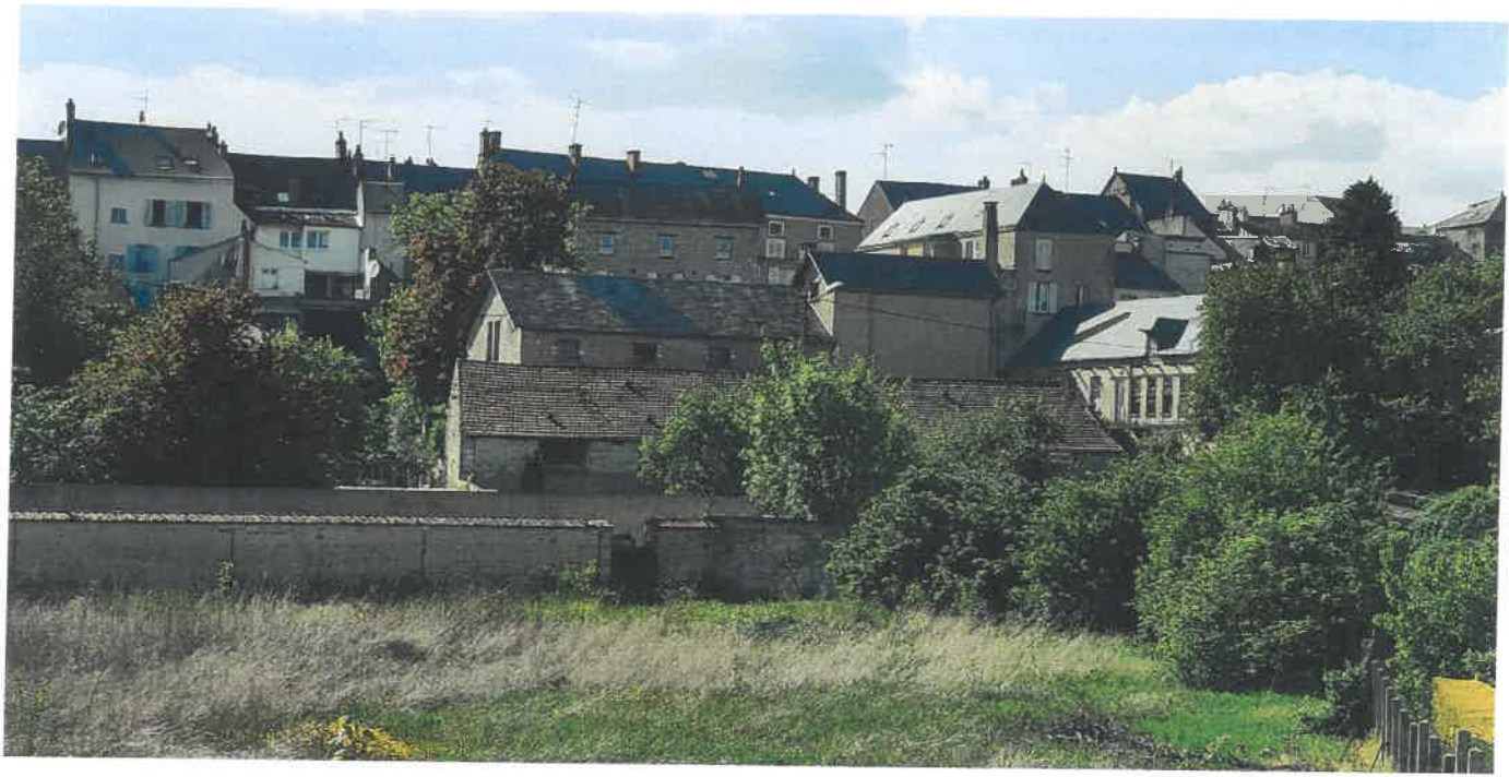
Vue de l'ancienne tannerie et des bureaux depuis le haut de Pithiviers