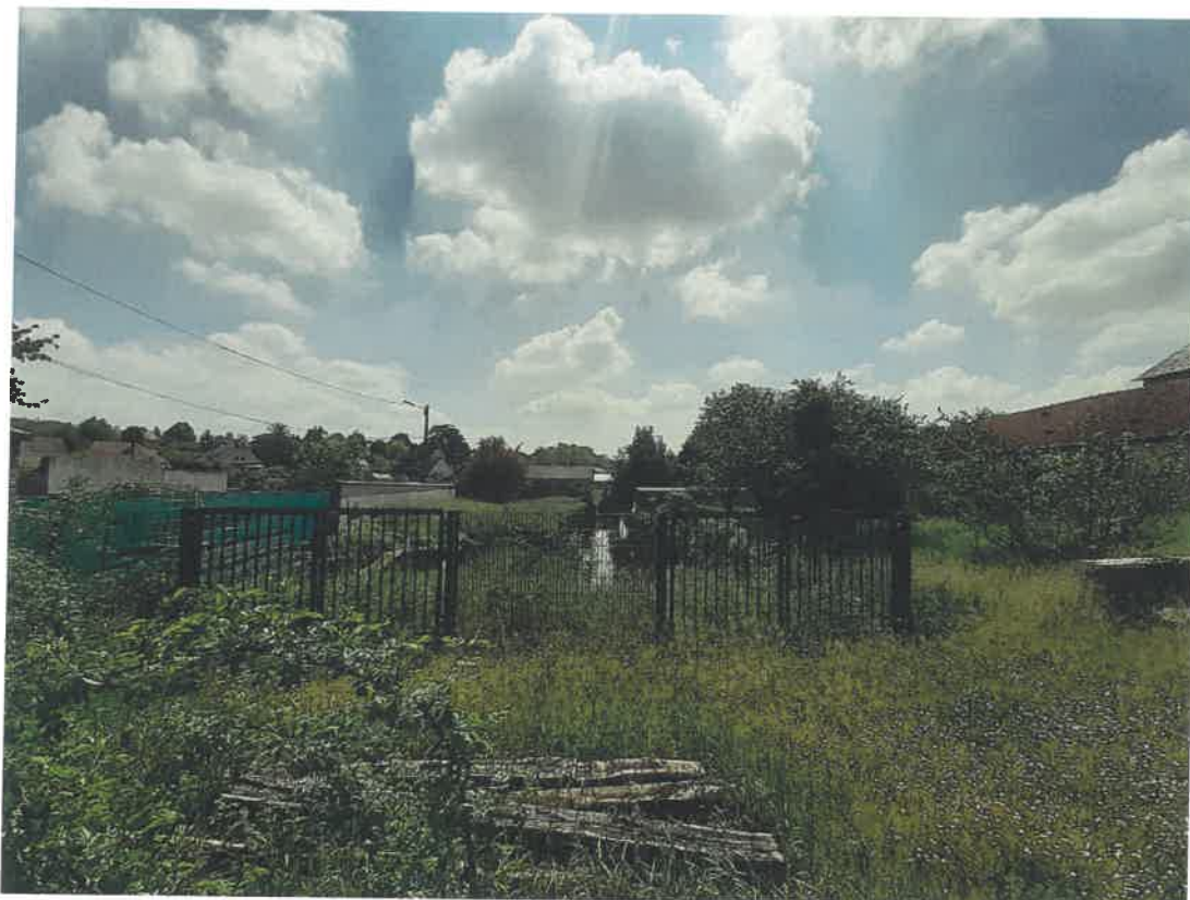
Photographie sur les espaces verts en fond de parcelle et du cour d'eau L'Œuf (zone NJ).