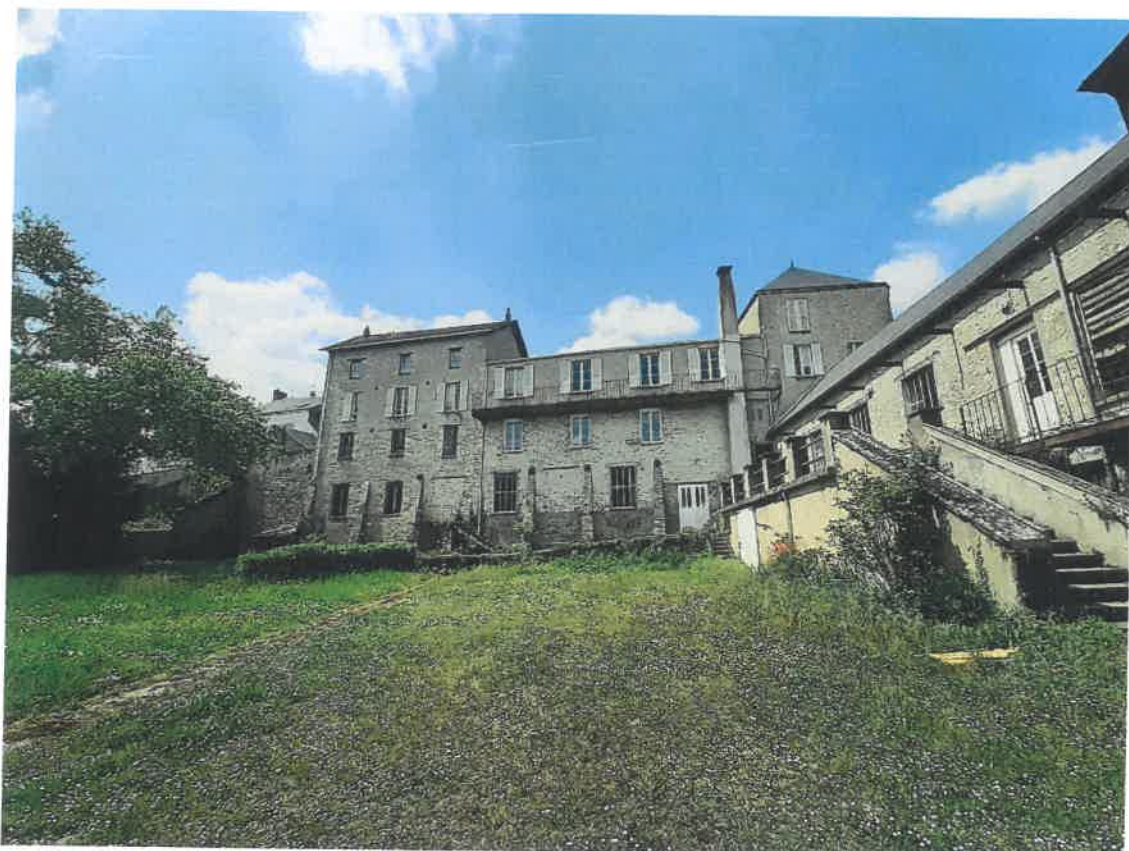
Photographie du bâtiment de bureaux (zone UA) et du bâtiment de la tannerie n°1 (zone NJ).