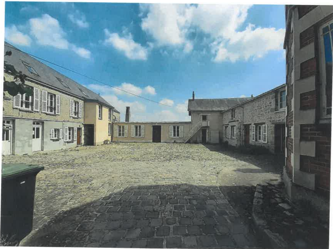
Vue sur la cour intérieure et des bureaux de la SAS Hursin et Fils (zone UA)