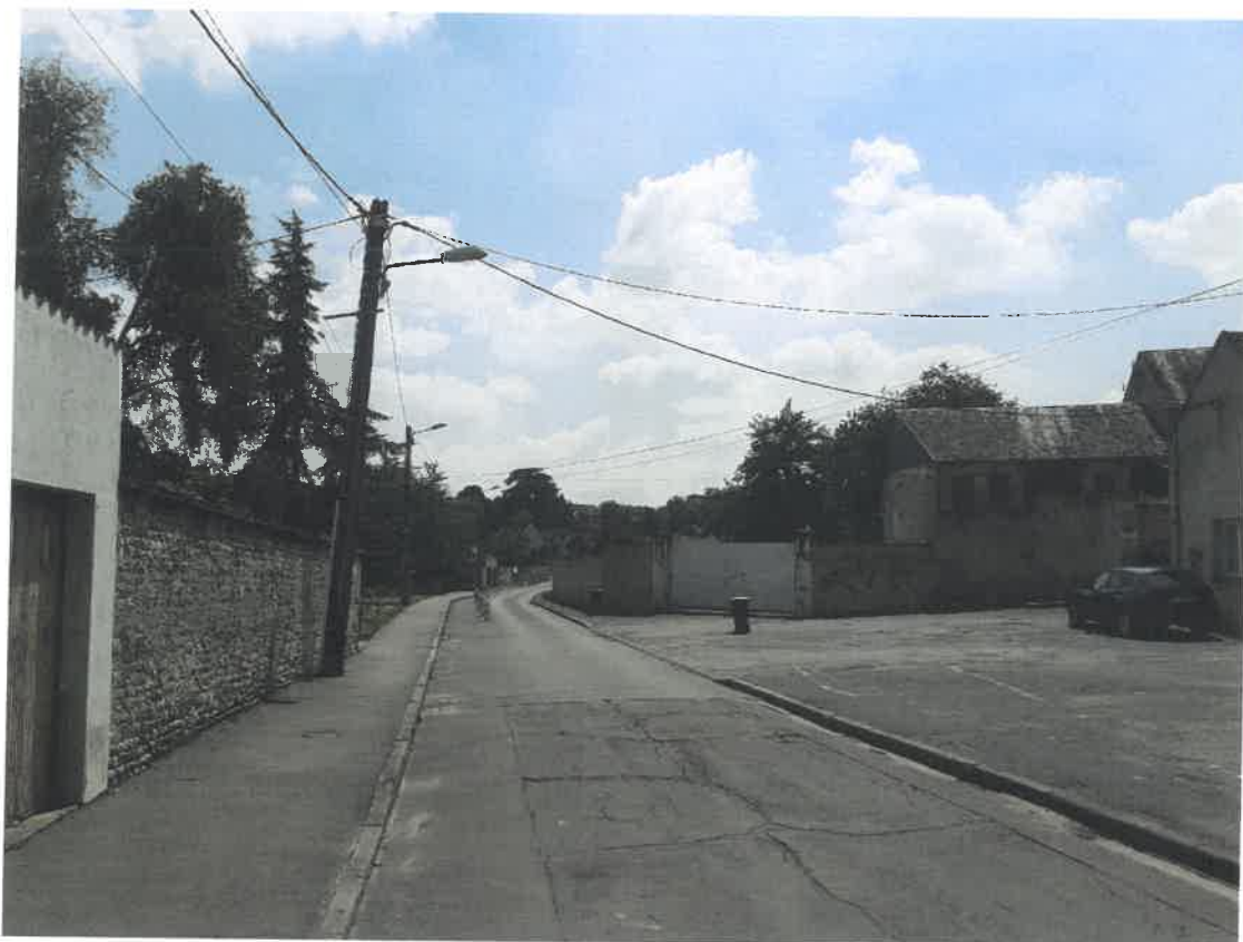
Vue sur accès rue Fricambault et aperçu sur le bâtiment de la tannerie situé derrière le mur en maçonnerie.