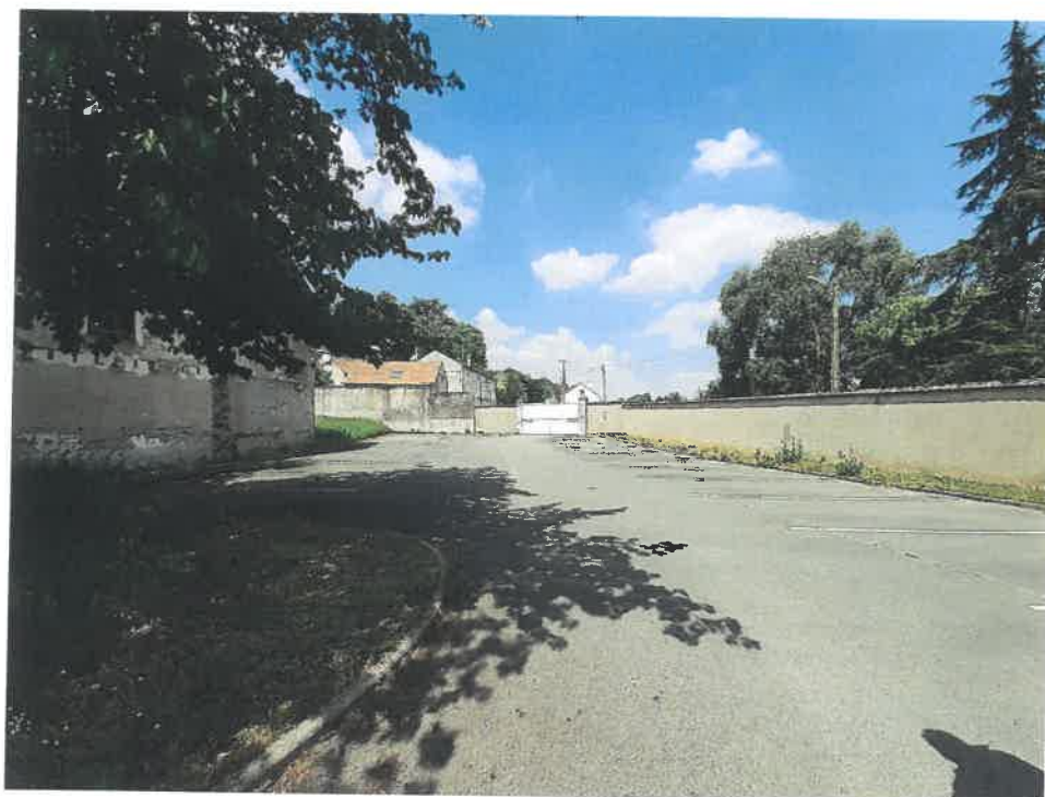
Vue sur le parking personnel et le portail d'accès à la rue Fricambault (zone NJ).