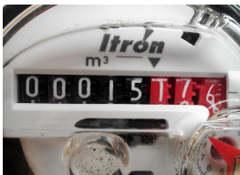
compteur à rouleaux