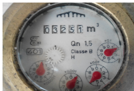
compteur à rouleaux et aiguilles

Dans ce cas, le compteur indique 15 m 3 . L'index relevé est donc 15 m 3 .